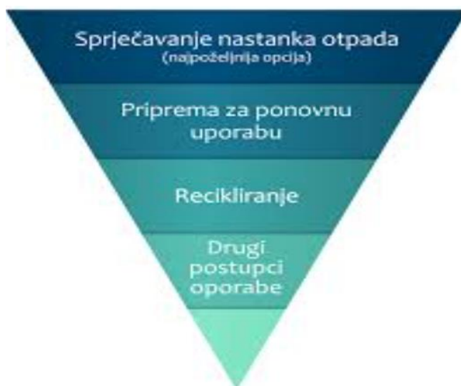
Slika 4.2./1. Red prvenstva gospodarenja otpadom

Neke od mjera, a posebice mjere navedene u Planu sprječavanja nastanka otpada, zahtijevaju provođenje na višoj razini (Republika Hrvatska), dok bi Jedinice lokalne samouprave sudjelovale indirektno u provođenju istih. Mjeru provođenje izobrazno-informativnih aktivnosti Grad Cres će provoditi u suradnji sa ostalim pravnim i privatnim subjektima koji se bave gospodarenjem otpadom.